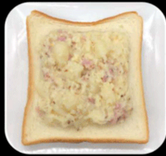
ベーコンポテト BACON POTATO 460(450)