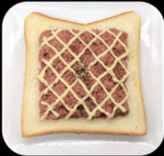
マヨコンビーフ MAYO CORNED BEEF 510(500)