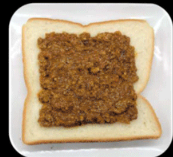
壱岐牛カレー IKIGYU CURRY 1,020(1,000)