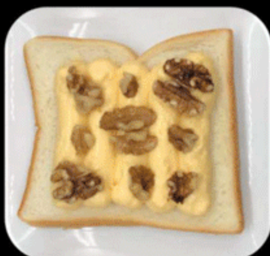
くるみカスタード KURUMI CUSTARD 390(380)