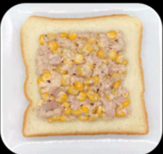
ツナマヨコーン TUNA MAYO CORN 410(400)