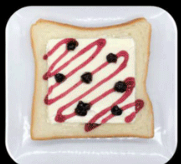
ベリークリームチーズ BERRY CREAM CHEESE 410(400)