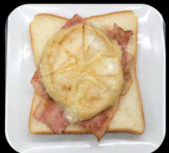
ベーコンカマンベール BACON CAMEMBERT 590(580)