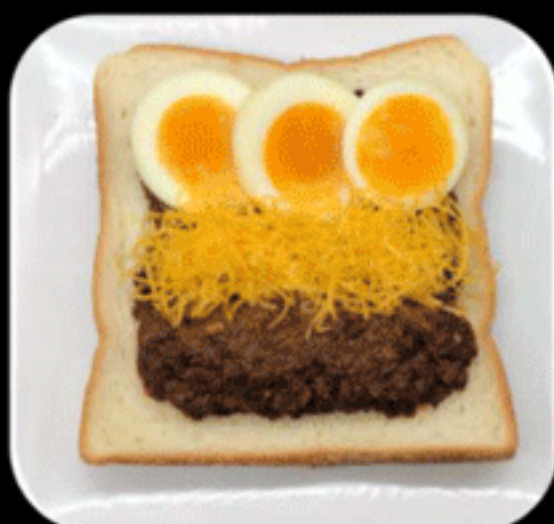
タコスエッグ TACOS EGG 560(550)