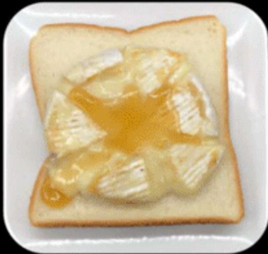
ハニーカマンベール HONEY CAMEMBERT 560(550)