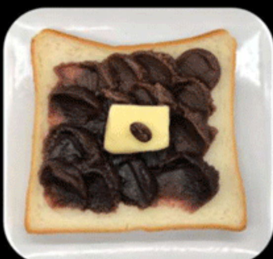
コーヒーあんバター COFFEE ANKO BUTTER 360(350)